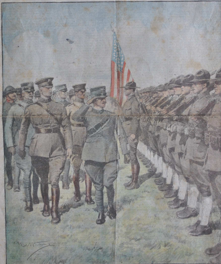
Il Re passa in rivista i magnifici soldati del primo contingente americano giunto sulla fronte italiana.

Si pubblica a Milano ogni Domenica Supplemento illustrato del "Corriere della Sera" MILANO Uffici del giornale: Via Solferino, N. 1288 Per tutti gli articoli e illustrazioni è riservata la proprietà letteraria e artistica, secondo le leggi e i trattati internazionali. Anno XX. - Num. 32. 11-18 Agosto 1918. Centesimi 10 il numero.