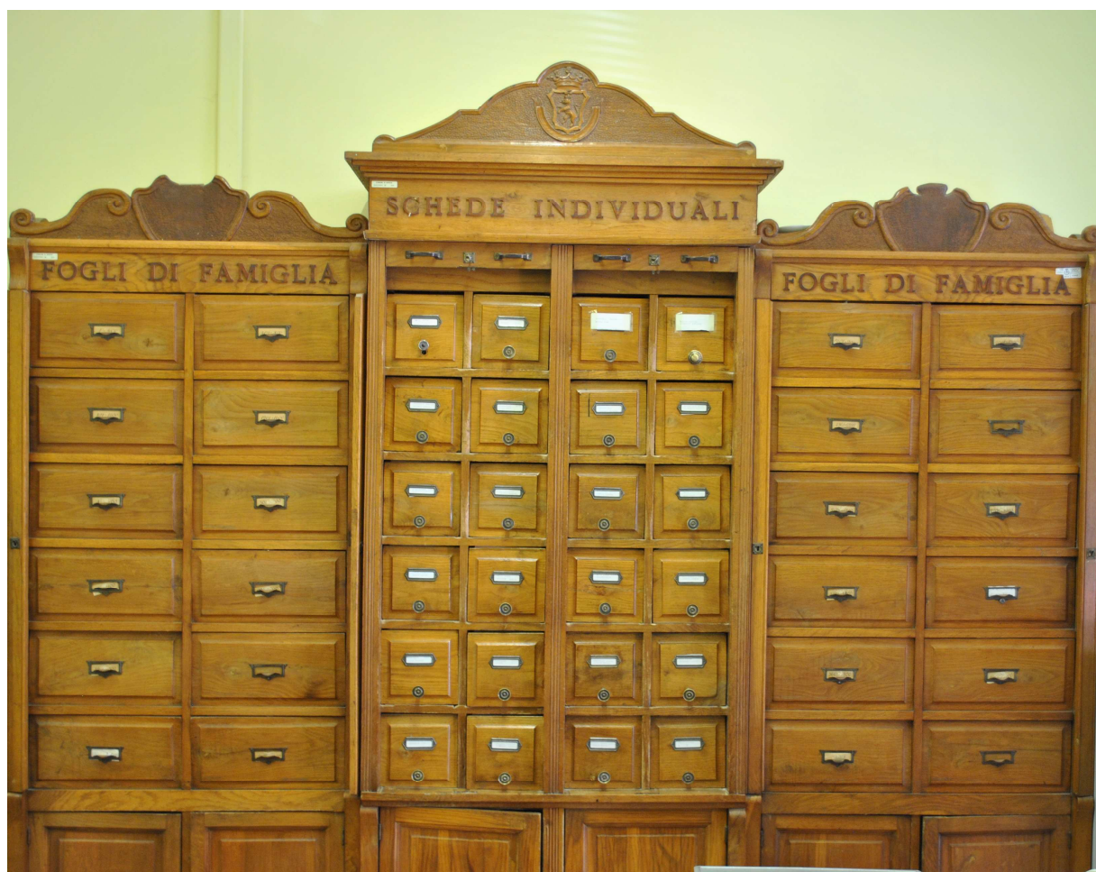
Armadio ligneo predisposto per la conservazione di “Fogli di famiglia e Schede individuali”, seconda metà XIX secolo Ufficio anagrafe del Comune di Norcia